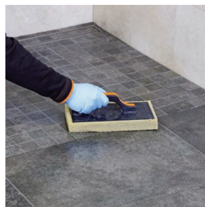
Závěrečný krok čištění: Dočištění plochy houbou.