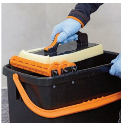
Vodu na umývání vyměňujte v pravidelných intervalech.